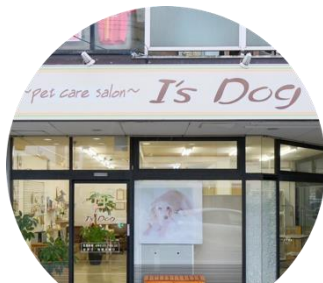
I's Dog 大治本店

I's Dogは、愛知県で5店舗を展開する地域密着型のトリミングサロンとして、ペットオーナーの皆様から高い信頼と支持をいただいています。この成功を共有し、新たな仲間と共に更なる成長を目指すため、フランチャイズオーナーを募集しています。