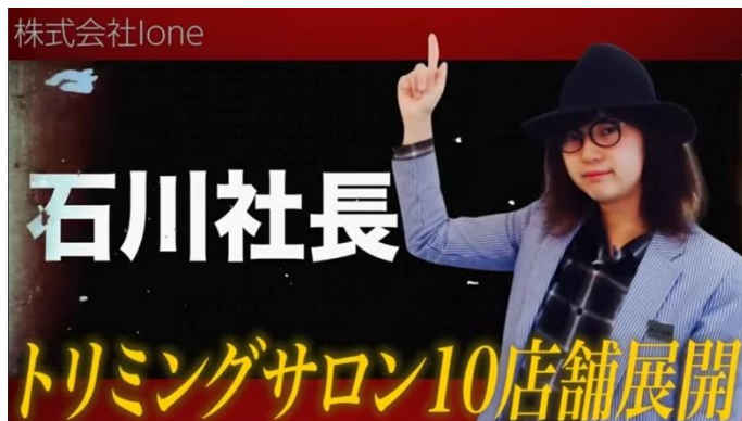
「社長ファイトクラブ」で紹介