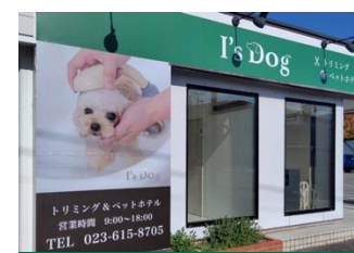
I's Dog 山形店