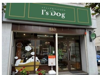
I's Dog 松本店

2024年にスタートしたI's Dogのフランチャイズ店舗募集は、多くのオーナー様からの支持を受け、続々と新店舗がオープンしています。すでに7店舗が開業！下記以外にも川越、仙台、八王子などの展開が決定しています。