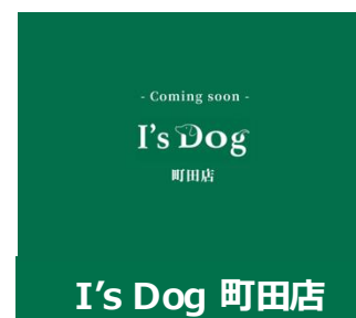
I's Dog 町田店