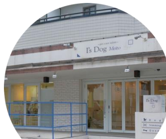
I's Dog 名東店