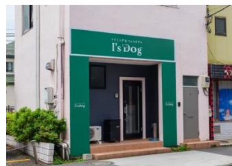
I's Dog 東部練馬・上板橋店