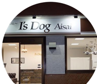
I's Dog 愛西店