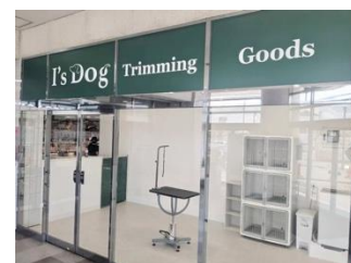
I's Dog 小牧店