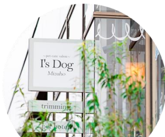
I's Dog 瑞穂店