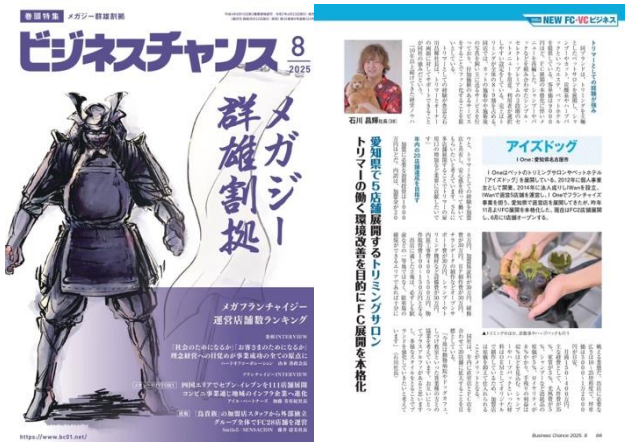
「ビジネスチャンス」の誌面特集

注目のビジネスモデルとして FC展開をさまざまなメディアで取り上げていただいています。