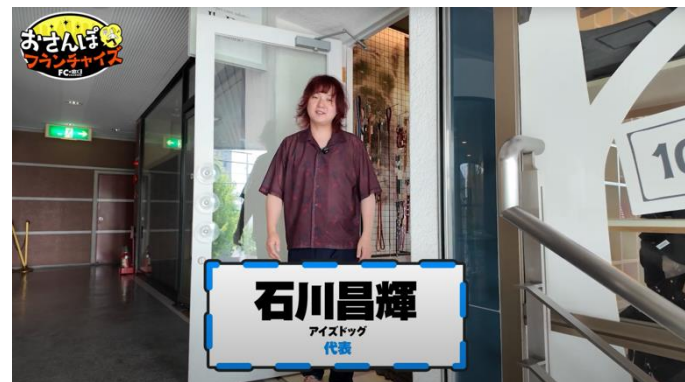
「フランチャイズの窓口チャンネル」で紹介