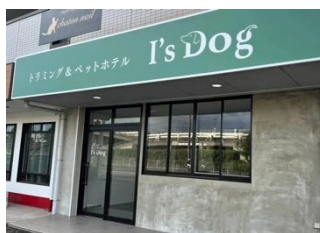
I's Dog 春日井店