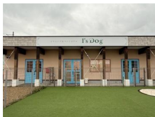
I's Dog 各務原店