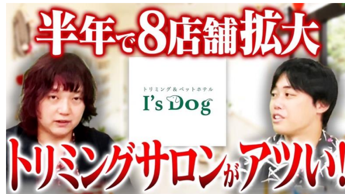
「フランチャイズ探偵団」さん出演