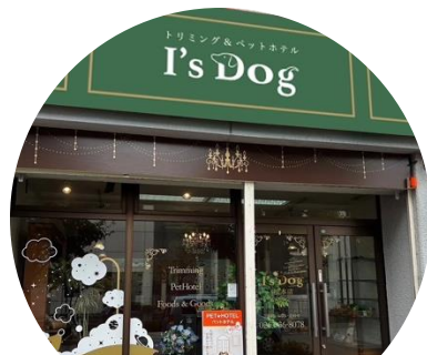
I's Dog 松本店

2024年にスタートしたI's Dogのフランチャイズ店舗募集は、多くのオーナー様からの支持を受け、続々と新店舗がオープンしています。2025年には、以下の2店舗が開業予定！