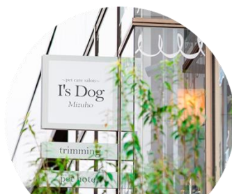
I's Dog 瑞穂店