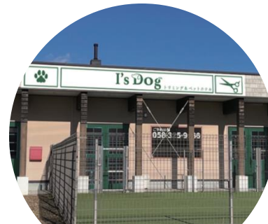
I's Dog 各務原店