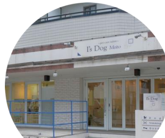
I's Dog 名東店