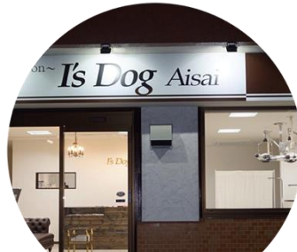
I's Dog 愛西店